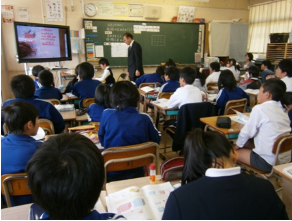
5年生 算数 「立方体と直方体の体積」