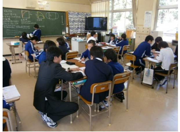
6年生 算数 「円の面積」