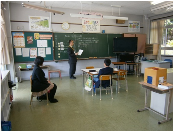
学び1 算数 「整数のかけ算とかけ算のひっ算」